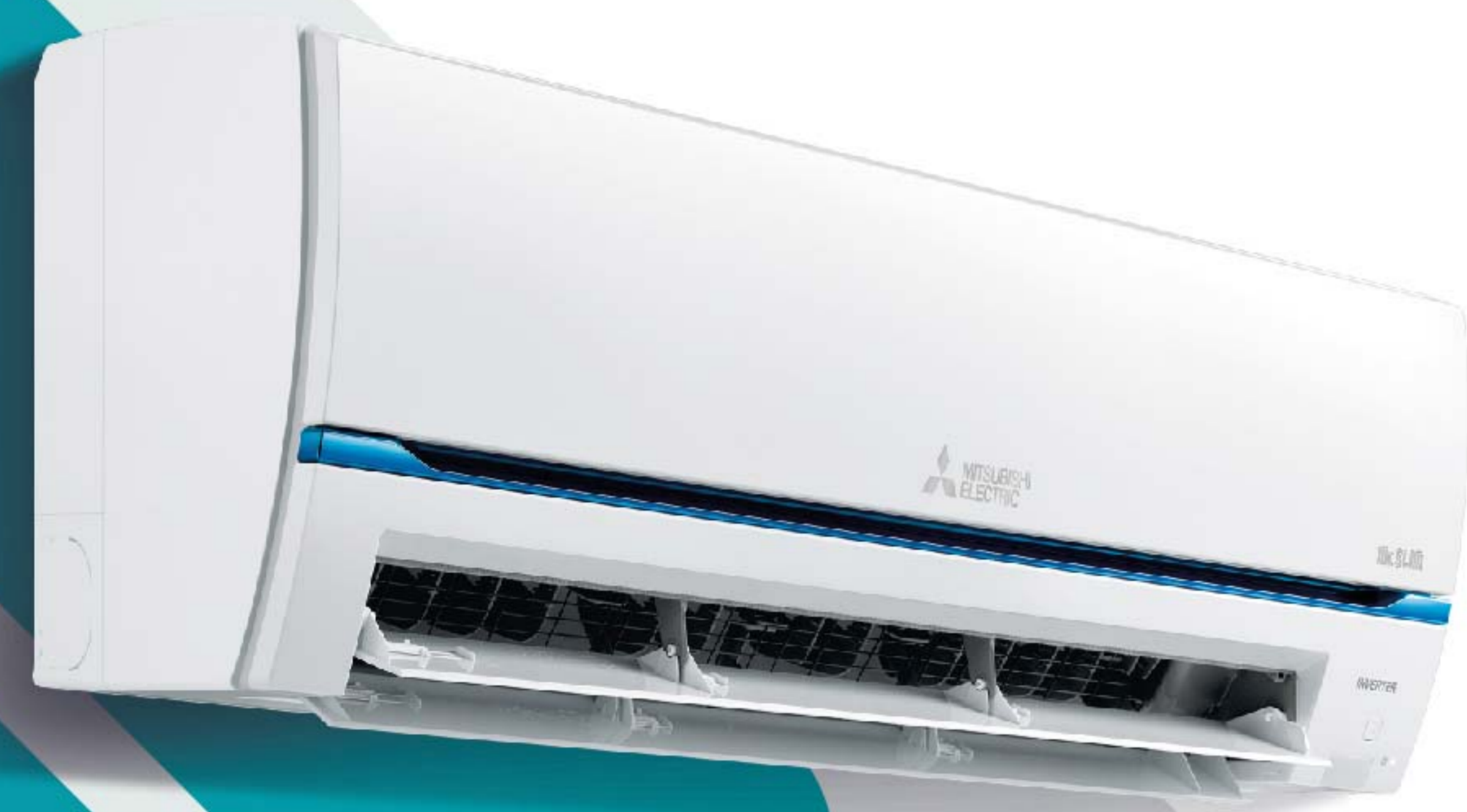
เครื่องปรับอากาศแบบติดผนัง (MS)

“รวดเร็วและมีประสิทธิภาพ” (SPEED & EFFICIENCY) ซึ่งเป็นหัวใจสำคัญที่เรา ยึดมั่นที่จะตอบสนองความต้องการของลูกค้าได้อย่างรวดเร็ว เพื่อยกระดับมาตรฐานการให้บริการ มิตซูบิชิ อิเล็กทริก กันยงวัฒนา ได้จัดตั้ง ทีมบริการใหม่ “EXPRESS TEAM” เพื่อบริการซ่อมเครื่องปรับอากาศ ด่วนภายใน 24 ชั่วโมง หลังจากได้รับเรื่องแจ้งซ่อมจากลูกค้า โดยทีมช่างเทคนิคผู้เชี่ยวชาญและอะไหล่มาตรฐาน มิตซูบิชิ อิเล็กทริก พร้อมให้คำปรึกษาและแนะนำ “เปลี่ยนทุกการบริการที่คุณเคยสัมผัส พร้อมสร้างความเชื่อมั่นและความประทับใจ”